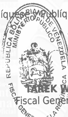
TAREK WILLIANS SAAB Fiscal General de la República